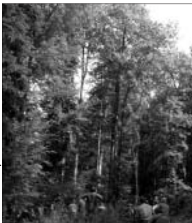
Účastníci medzinárodnej exkurzie lesníkov v lesných porastoch v Hnilickej doline.