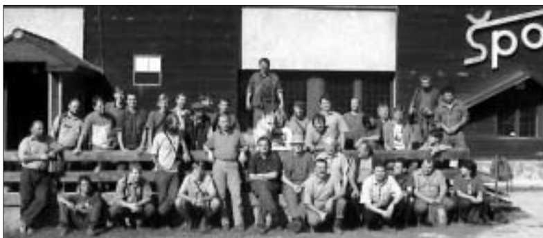
Všetci účastníci medzinárodnej exkurzie spolu s lektormi v čergovských jedľobučinách na východnom Slovensku.