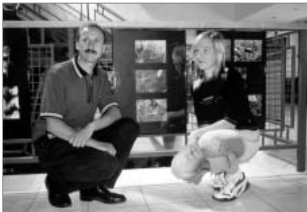
Dvaja z poľských výhercov fotosúťaže pri svojich prácach.

V roku 2005 sme spolu s naším poľským partnerom, mimovládnu organizáciou Stowarzyszenie „Olszówka“, pokračovali v uskutočňovaní cezhraničného projektu Príroda nepozná hranice. V tomto roku bola jednou z hlavných aktivít fotografická súťaž Prírodné krásy Beskyd. Súťaž bola určená študentom